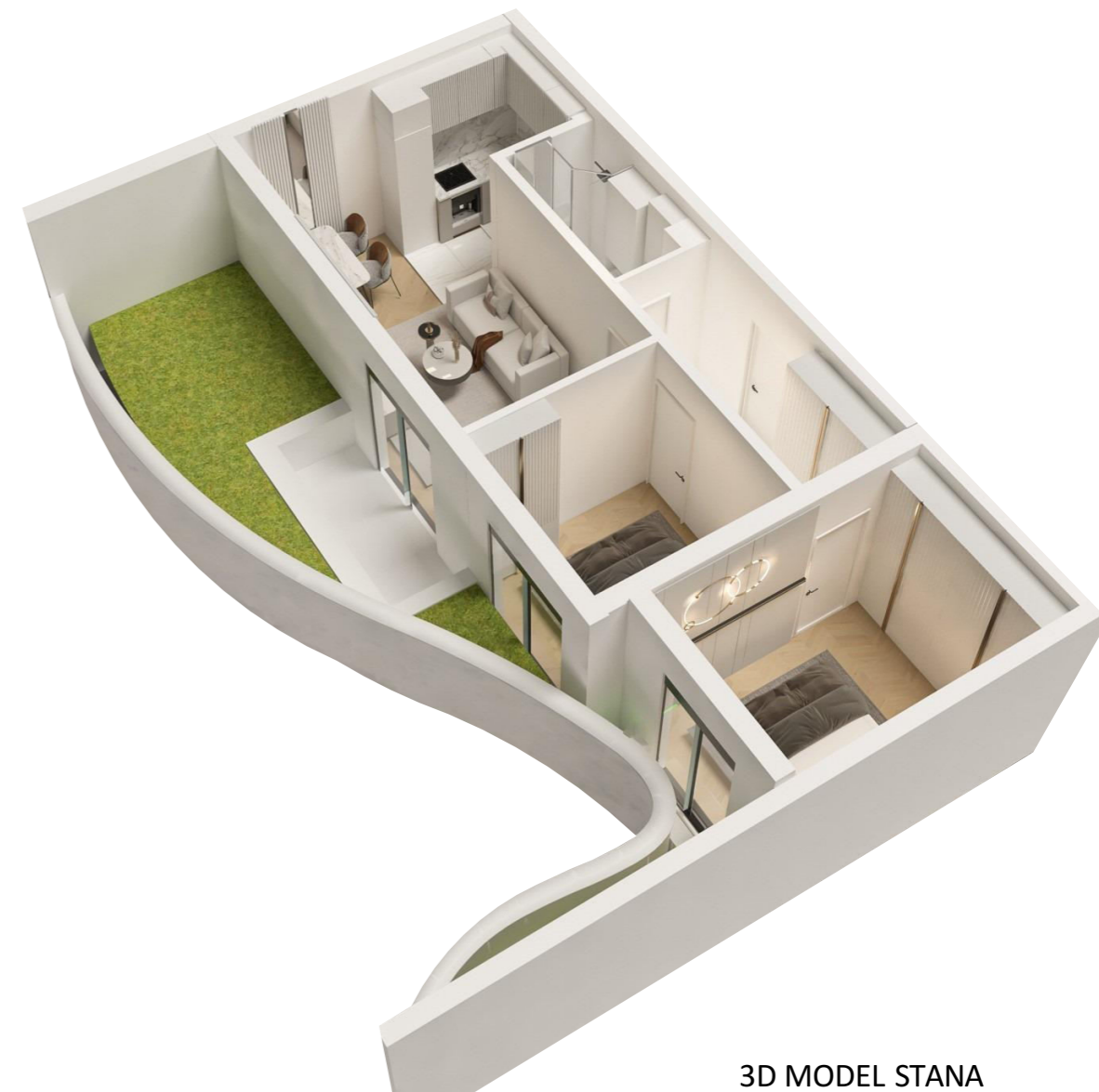
3D MODEL STANA